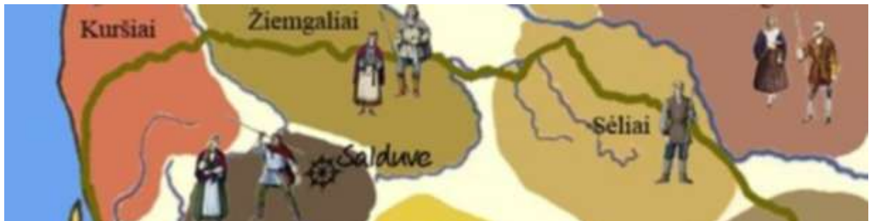
Rysunek 2: Obszary występowania dawnych plemion kurońskich, zemgalskich i żelowskich na Litwie i Łotwie

Zgodnie z informacjami dostępnymi na stronie www.baltukelias.lt , Szlak Bałtów obejmuje obecnie ponad 230 obiektów na Litwie i Łotwie. Szlak Bałtów jest trasą o długości 2 145 km, która, obejmując tereny dzisiejszej Litwy i Łotwy, prowadzi przez obszary zamieszkałe niegdyś przez Kurów (~790 km), Zemgalów (~620 km) i Żelów (~735 km).